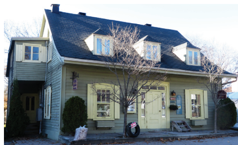
▲ Maison Blanchette, rue Provancher.

Maison Idelphonse-Delisle, rue Provancher. ▼