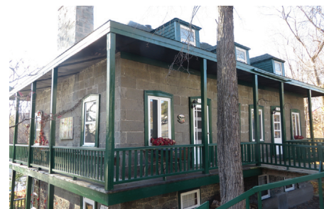
▲ Maison en pierre Everell, côte de Cap-Rouge.

Maison Idelphonse-Delisle, rue Provancher. ▼