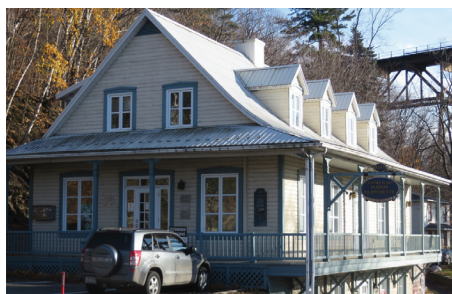
▲ Maison Blanchette, côte de Cap-Rouge.