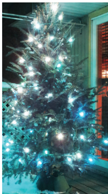
Sapin extérieur cour arrière