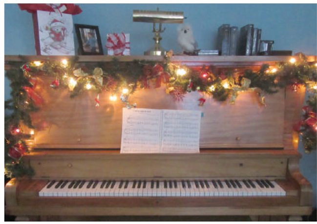
Que serait Noël sans la musique ou quand le piano se met beau !