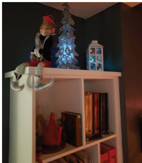
Le lutin coquin !