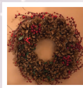
Couronne de cocottes de pins.