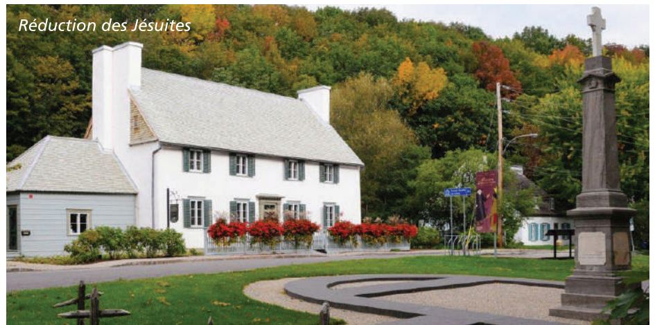
Réduction des Jésuites