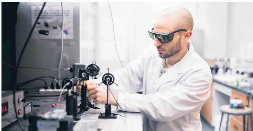
Seul établissement universitaire au Québec dédié exclusivement à la recherche et à la formation d'étudiants aux 2 e et 3 e cycles, l'INRS contribue au développement de la société québécoise par ses découvertes et ses innovations scientifiques, sociales et technologiques.

➤ 600 étudiants autochtones sont inscrits annuellement, dont 11 % aux cycles supérieurs.