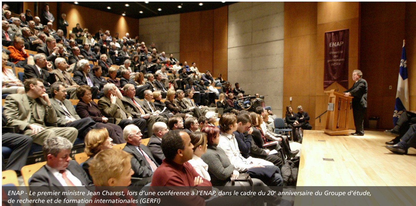
ENAP - Le premier ministre Jean Charest, lors d'une conférence à l'ENAP, dans le cadre du 20 e anniversaire du Groupe d'étude, de recherche et de formation internationales (GERFI)

AVRIL 2010 / ASSEMBLÉE DES GOUVERNEURS DU 21 AVRIL 2010