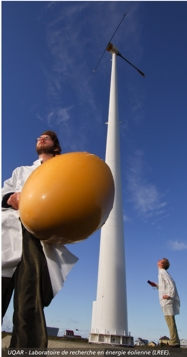
UQAR - Laboratoire de recherche en énergie éolienne (LREE).