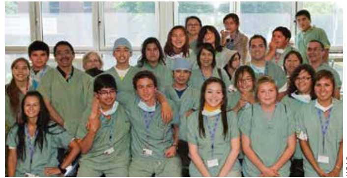
Élèves du Camp santé jeunesse autochtone