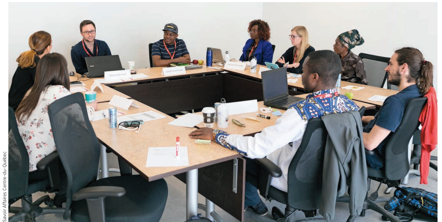
Savoir Affaires, Centre-du-Québec

Animés par une mission d'accessibilité, d'innovation et de création scientifique ainsi que de développement de leurs milieux, les dix établissements de l'Université du Québec valorisent l'entrepreneuriat comme cheminement de carrière, d'actualisation professionnelle et de recherche. En plus d'offrir des programmes de formation, ils développent des collaborations avec les organisations publiques et privées dans le but de dynamiser la vie entrepreneuriale de la société.