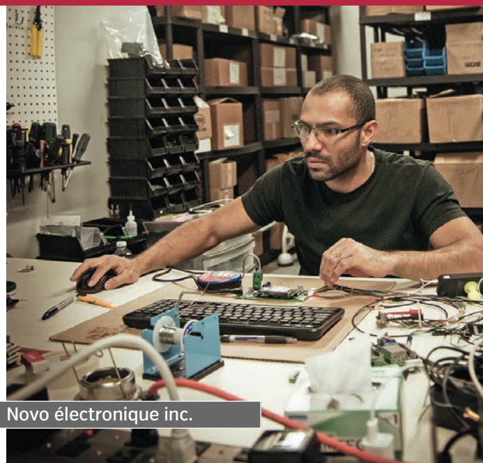
Novo électronique inc.